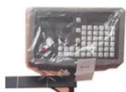
Visualizador de cota 3 ejes, SINO