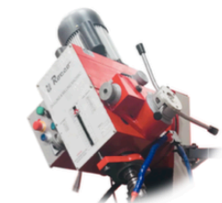
Avance Automatico en el Husillo MT4