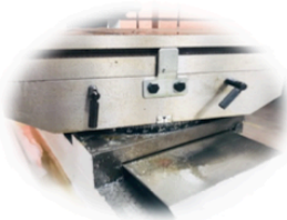
Mesa 1000X240mm Giratoria a 45°