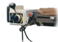
Avance Automatico En la mesa eje X